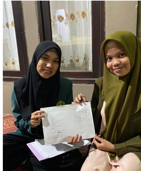
b. Kunjungan rumah pengambilan Kuesioner