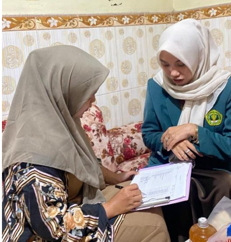
a. Pengisian Kuesioner