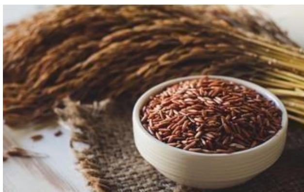
Gambar 1. Beras Coklat