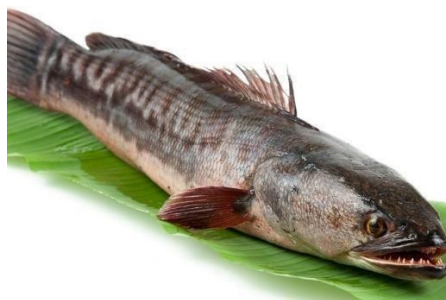
Gambar 3. Ikan Gabus