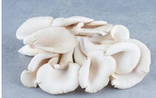
Gambar 2. Jamur Tiram