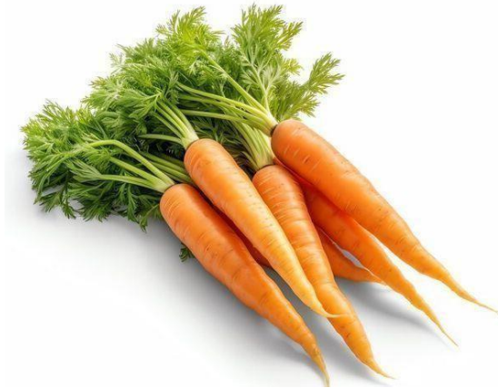
Gambar 4. Wortel