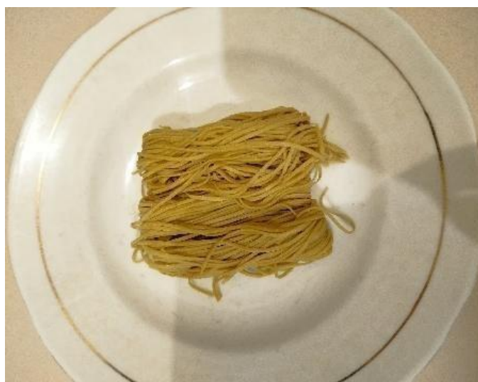
Gambar 2. Penelitian Pendahuluan Mie Basah

Penelitian pendahuluan menunjukkan bahwa setiap perlakuan menghasilkan 120 gram mie basah. Uji organoleptik membutuhkan sebanyak 25 panelis agak terlatih yang masing-masing diberikan sampel seberat 15 gram. Total sampel setiap taraf perlakuan yang dibutuhkan untuk keperluan uji mutu gizi dan uji mutu organoleptik sebanyak 475 gram.