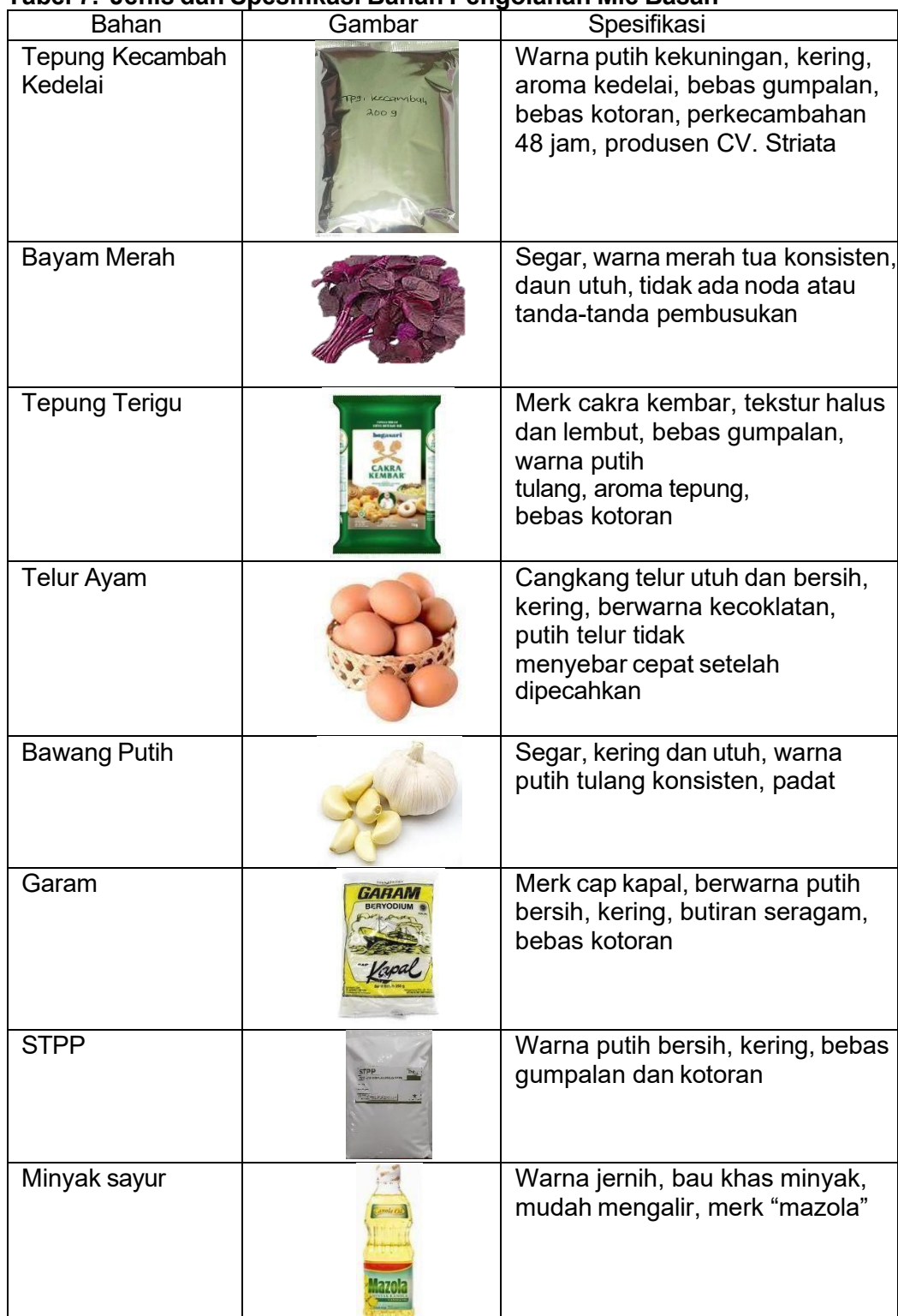
Tabel 7. Jenis dan Spesifikasi Bahan Pengolahan Mie Basah