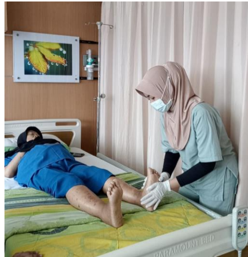
Pelaksanaan Intervensi Ankle Pumping Exercise Hari ke-1 di Ruang Platinum 3 RS Lavalette pada 30 April 2025