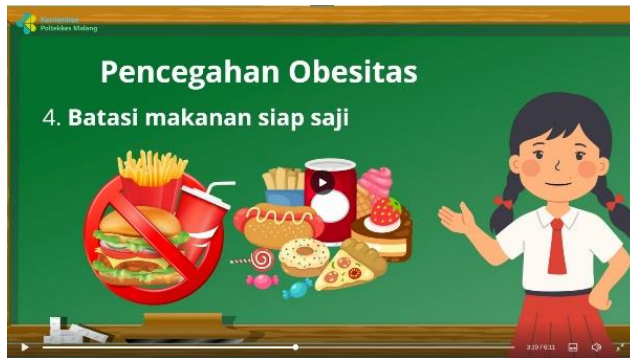
Penjelasan pencegahan obesitas