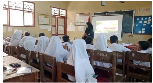
Tanya jawab dan penutup