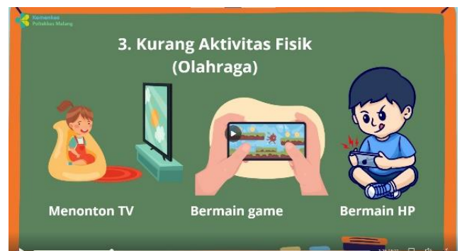
Penjelasan penyebab obesitas