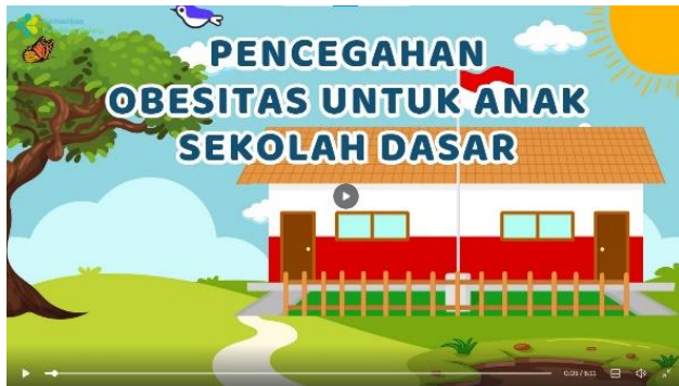
Judul & pembuka video animasi