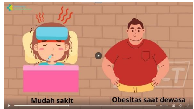
Penjelasan dampak obesitas