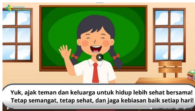
Penyampaian pesan ajakan berperilaku hidup sehat