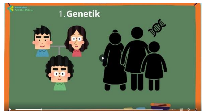
Penjelasan penyebab obesitas