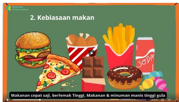
Penjelasan penyebab obesitas