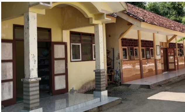
Ruang kelas dan kantor guru