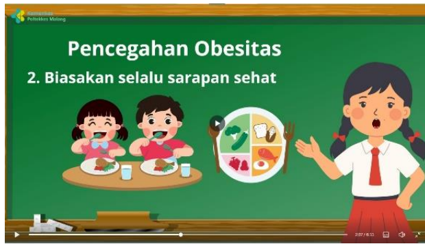
Penjelasan pencegahan obesitas