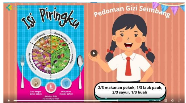
Penjelasan pedoman gizi seimbang