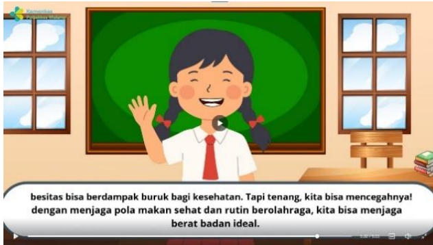
Reinforcement dan kesimpulan