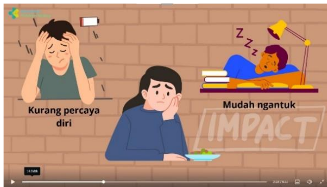
Penjelasan dampak obesitas