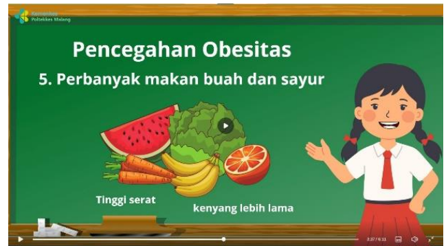
Penjelasan pencegahan obesitas