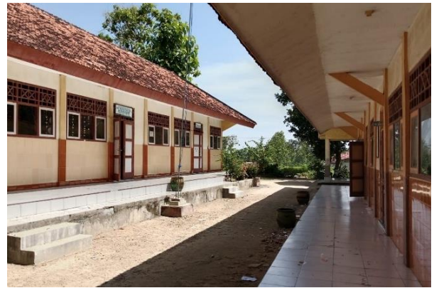
Halaman Sekolah dan ruang kelas