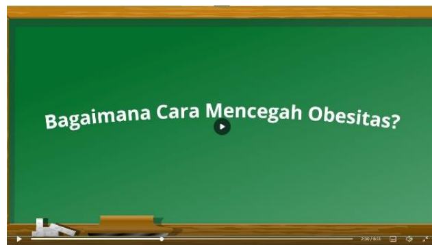
Penjelasan pencegahan obesitas