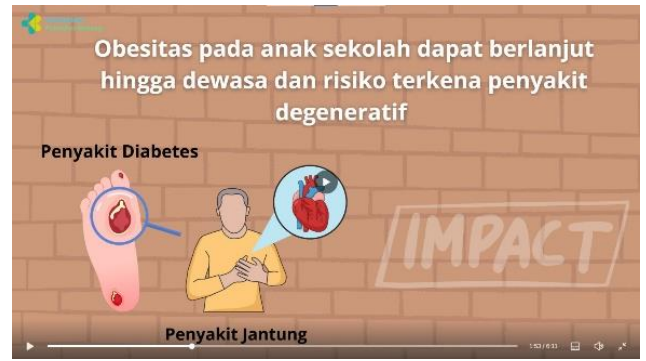
Penjelasan dampak obesitas