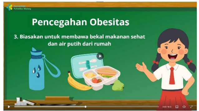
Penjelasan pencegahan obesitas