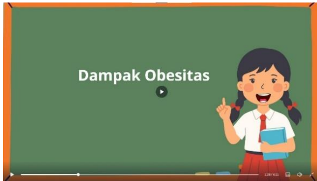
Penjelasan dampak obesitas