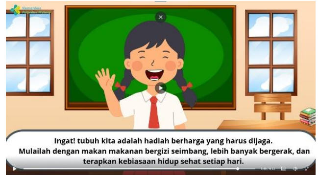
Penyampaian pesan ajakan berperilaku hidup sehat