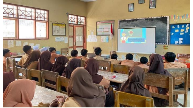
Pemutaran video animasi tentang pencegahan obesitas