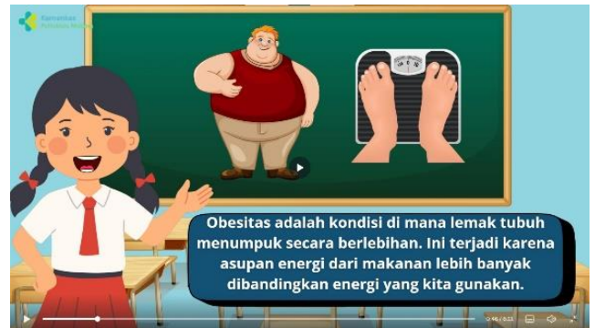
Penjelasan pengertian obesitas