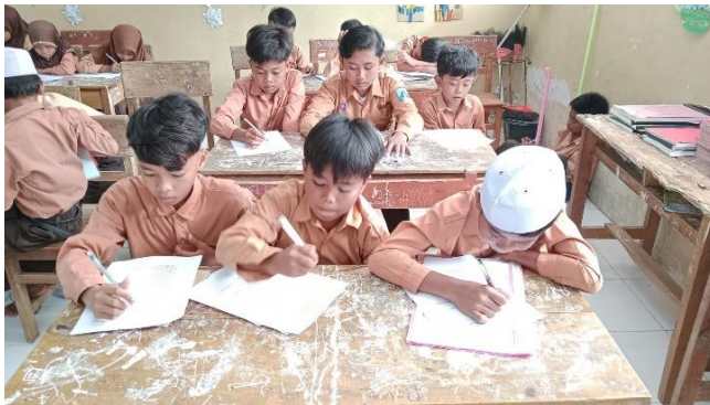
Pengisian post test