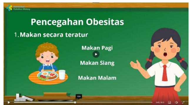
Penjelasan pencegahan obesitas