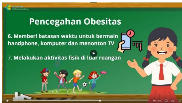
Penjelasan pencegahan obesitas