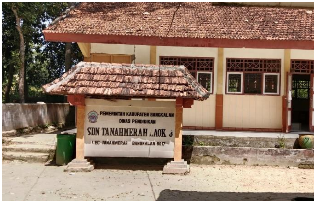
Sekolah SDN Tanahmerah Laok 3