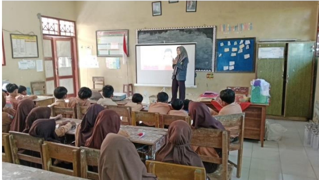
Pembukaan dan penjelasan pedoman gizi seimbang