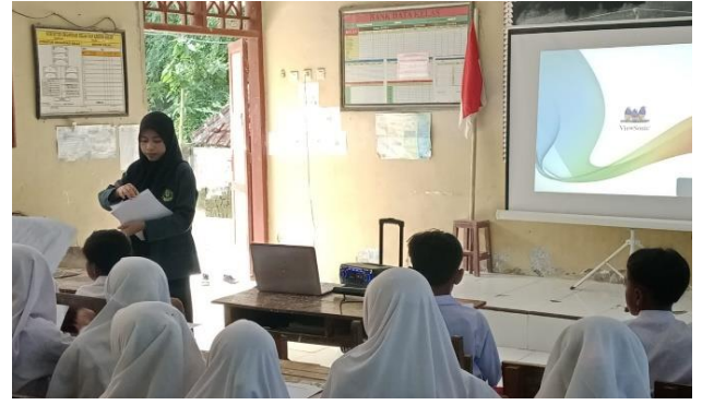
Pengisian informed consent dan pre test