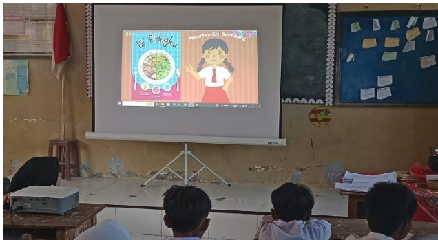
Pemutaran video animasi tentang pencegahan obesitas