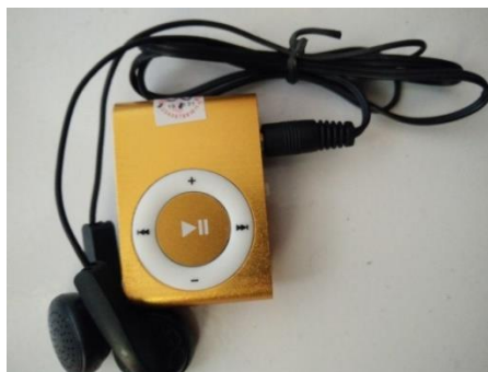
Gambar 3.2 Mp3 merk Player Music Smart

Instrumen penelitian merupakan alat yang digunakan untuk pengumpulan data, instrumen penelitian berupa lembar observasi, formulir-formulir lain yang berhubungan dengan pencatatan data (Notoatmodjo 2018). Instrumen pengumpulan data yang digunakan dalam penelitian ini adalah dengan menggunakan lembar skala nyeri NRS ( Numerical Rating Scale ), instrumen yang digunakan untuk pemberian musik kepada responden menggunakan media mp3 merk player music smart