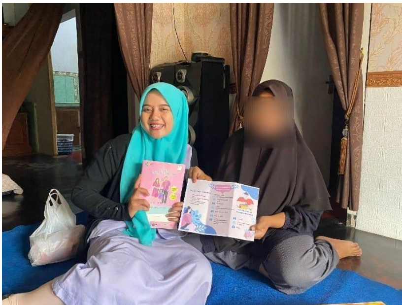
Gambar 1.10 kunjungan ke 2