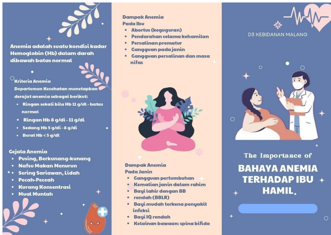
Gambar 1.1 Bahaya Anemia terhadap ibu hamil