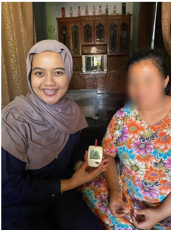
Gambar 1.14 Dokumentasi