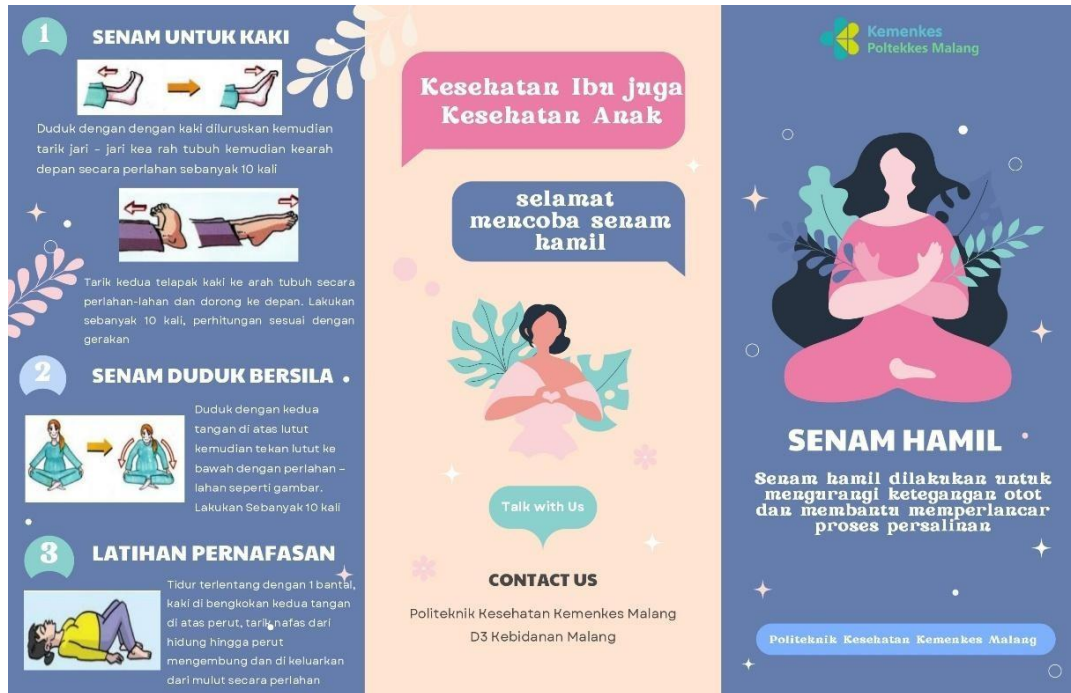
Gambar leaflet senam hamil 1.5