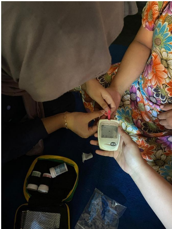
Gambar 1.12 pemeriksaan hb stick menggunakan easytouch