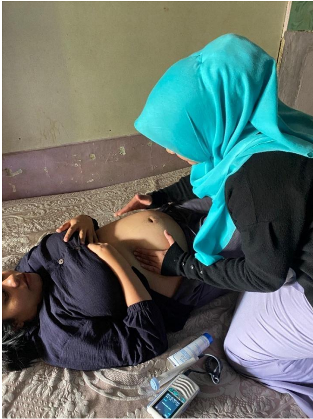
Gambar 1.9 pemeriksaan leopold 1-4