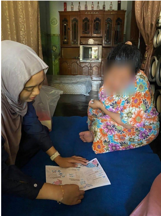
Gambar 1.11 kunjungan ke 3