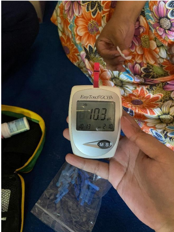
Gambar 1.13 hasil pengecekan Hb