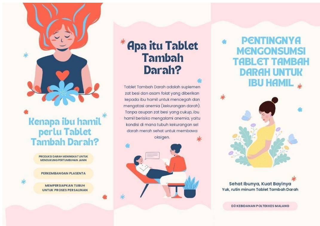
Gambar leaflet 1.3 Pentingnya mengonsumsi tablet tambah darah