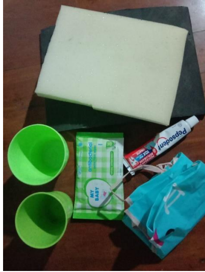
Gambar 2. 3 Alat dan Bahan Pembuatan Oral Hygiene Kit