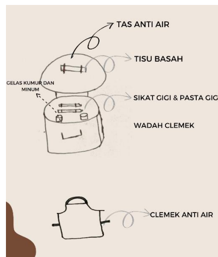
Gambar 2. 2 Desain Oral Hygiene Kit