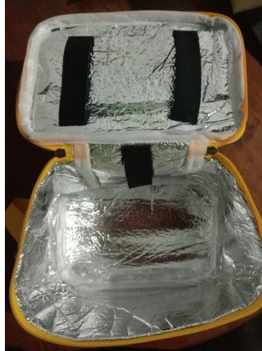
Gambar 2.5 Model Tas