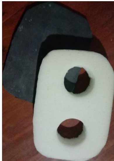
Gambar 2. 4 Bentuk Spons