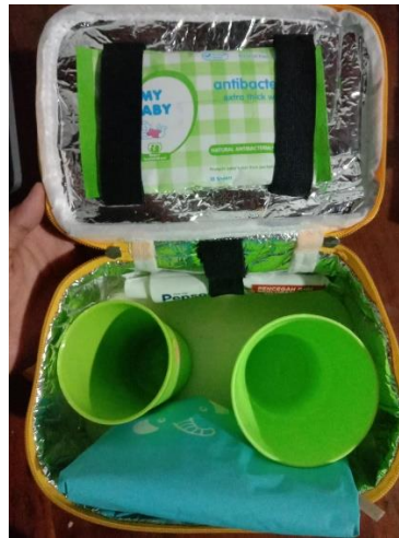
Gambar 2. 6 Produk Oral Hygiene Kit