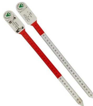
Gambar 2.1 Pita Lingkar Lengan Atas

Salah satu pilihan untuk penentuan status gizi dikarenakan mudah dilakukan serta tidak membutuhkan alat-alat yang sulit, namun demikian meskipun mudah dilakukan pengukuran terdapat beberapa hal yang perlu mendapat perhatian, terutama pengukuran LILA ini digunakan sebagai pilihan utama untuk indikator pengukuran status gizi pada ibu hamil. Pengukuran LILA juga merupakan suatu cara untuk mengetahui resiko kekurangan energi protein pada WUS (Wanita Usia Subur). Pengukuran LILA tidak dapat digunakan dalam jangka pendek karena perubahan ukuran lingkaran lengan atas hanya (Supriasa, 2018).