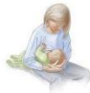
Gambar 2. 5 Football Hold