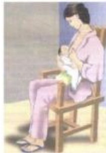
Gambar 2. 1 Posisi Bersandar