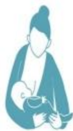
Gambar 2. 3 Cradle Hold