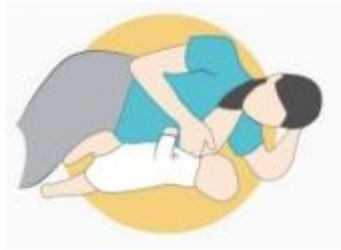
Gambar 2. 2 Berbaring Miring