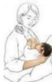
Gambar 2. 4 Cross Cradle Hold