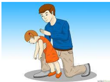
Gambar 2 Teknik Back Blow