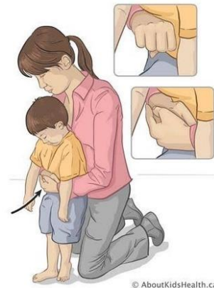
Gambar 3 Teknik Heimlich manuver