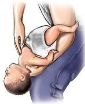
Gambar 4 Teknik Chest Thrust

Apabila korban kehilangan kesadaran, baringkan korban secara perlahan sehingga posisinya terlentang dan mulai lakukan RJP. Setiap saluran napas dibuka saat RJP, penyelamat harus memeriksa apakah terdapat benda asing pada mulut korban dan mengambilnya apabila menemukannya.